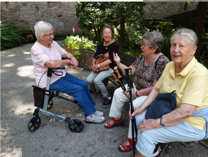
Die Frauengruppe unterwegs