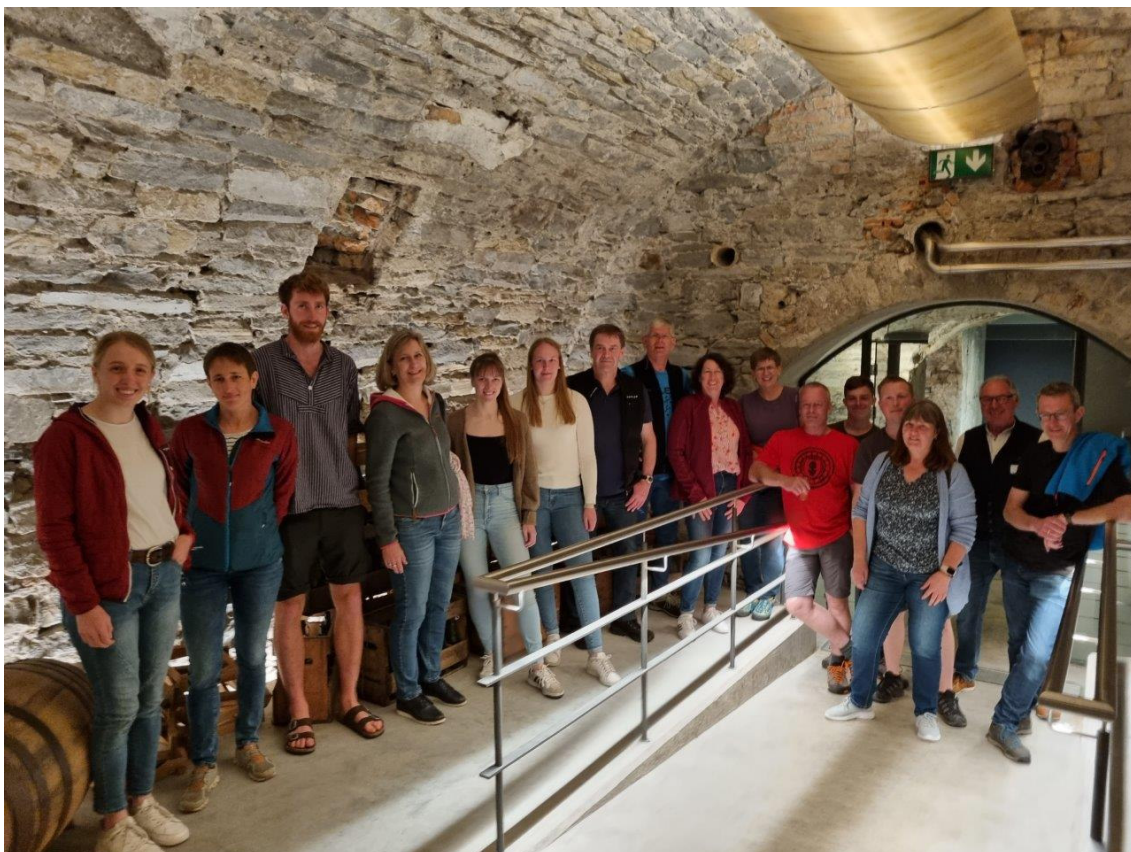
Führung durch die Brauerei Zötler – schee wars...und lecker!