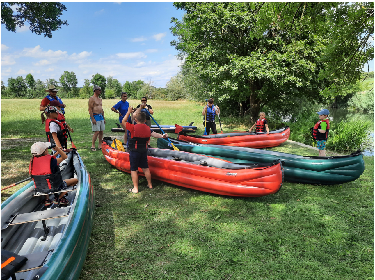
Die Kindergruppe beim Kanusport