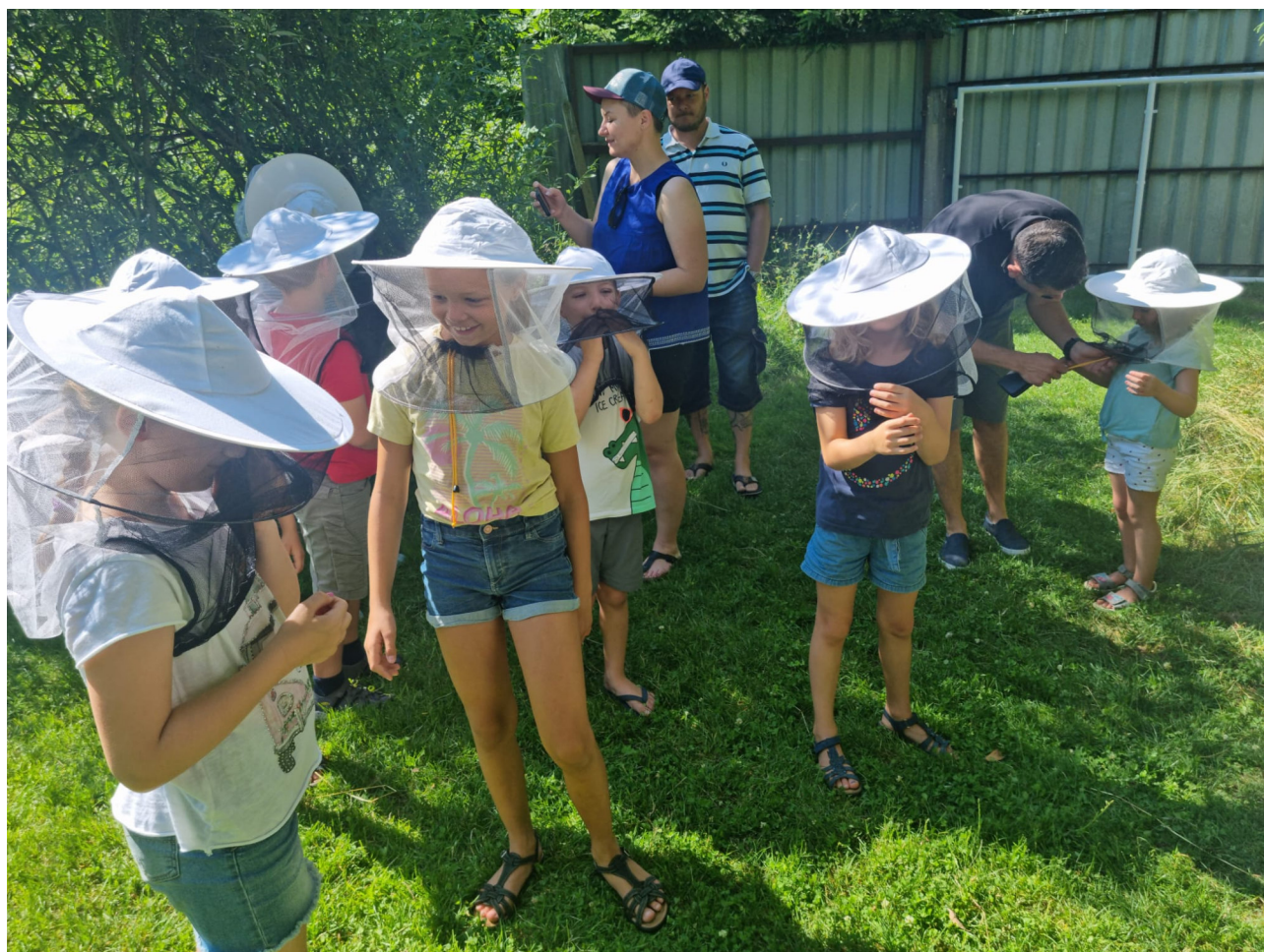
Kindergruppe zu Besuch beim Imker