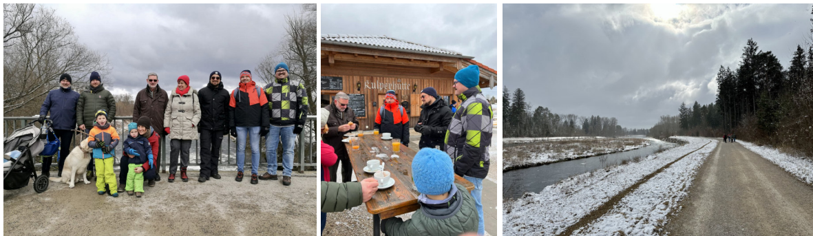
Winterwanderung an der Wertach zur Kulperhütte